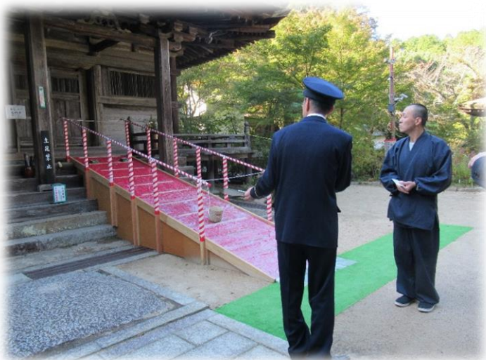
⇒ 緊急特別査察の様子

市民共有の財産であり、将来に継承すべき貴重な文化財を火災などの災害から守るためには、文化財の関係者だけでなく地域住民の皆さんの協力が必要です。皆さんも、この機会に身近にある文化財に目を向け、地域ぐるみで守りましょう。