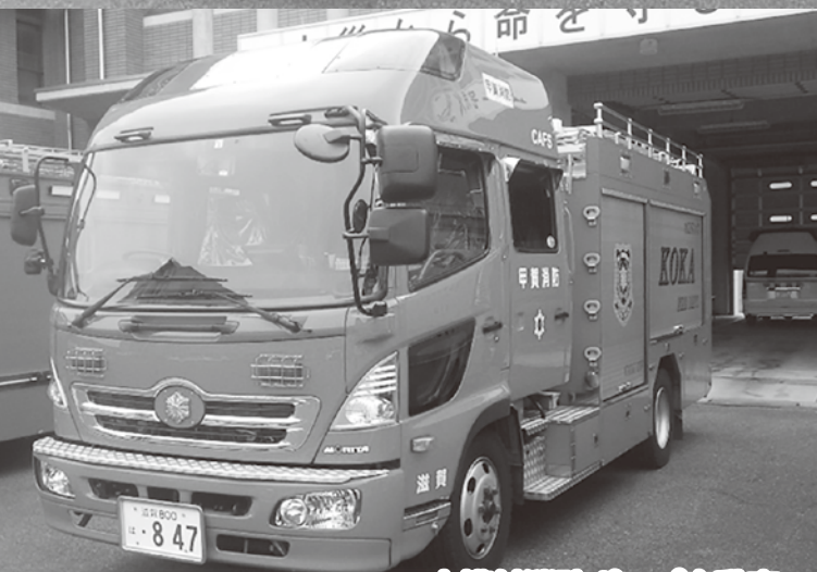
水槽付消防ポンプ自動車