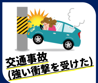
交通事故(強い衝撃を受けた)