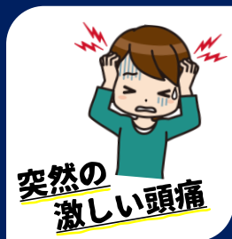
突然の激しい頭痛