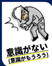
意識がない(意識がもうろう)